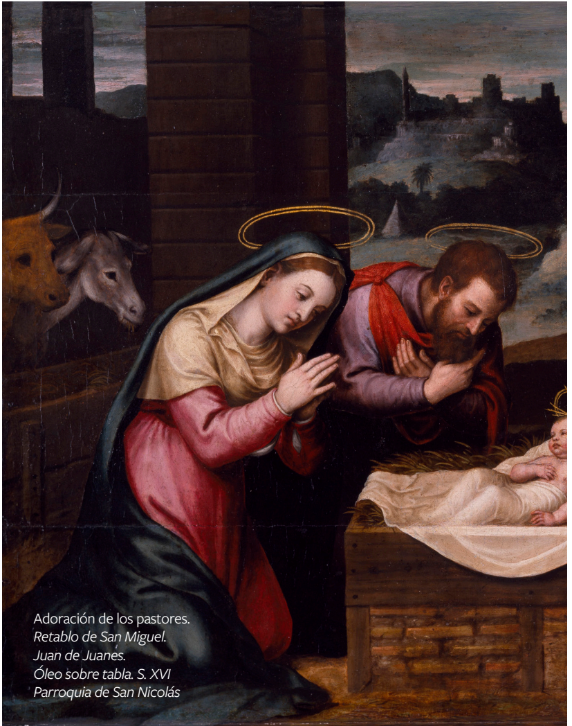
Adoración de los pastores. Retablo de San Miguel. Juan de Juanes. Óleo sobre tabla. S. XVI Parroquia de San Nicolás